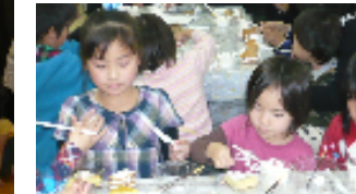
お菓子の家を作りました