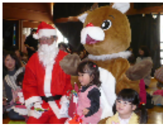
サンタさんとトナカイさんが 来てくれました