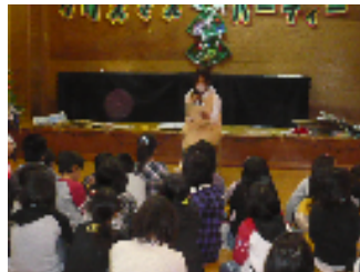
ゲーム遊びをして